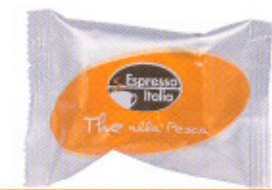
The alla pesca