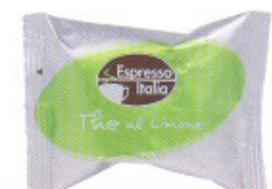
The al limone